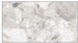
チェッポディグレ