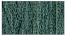
ノルディック グリーン