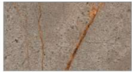
ブロンズアマーニ