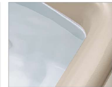
シルキーベージュ