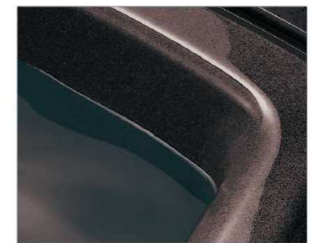
ラスターブラック