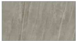
ジオマーブル モスグレー