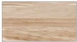
チェスナット ベージュ