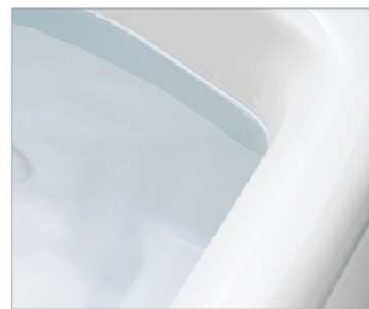
プレシャスホワイト