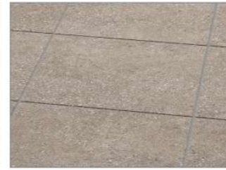
ピエトラグレージュ