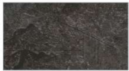
ビンテージアイアン