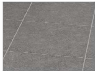
カームダークグレー