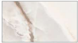
ホワイトオニキス