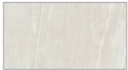
ジオマーブル アイボリー