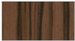
グレイスエボニー