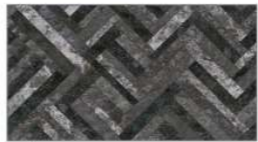
ジュエリータイル