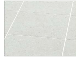
チェッポビアンコ